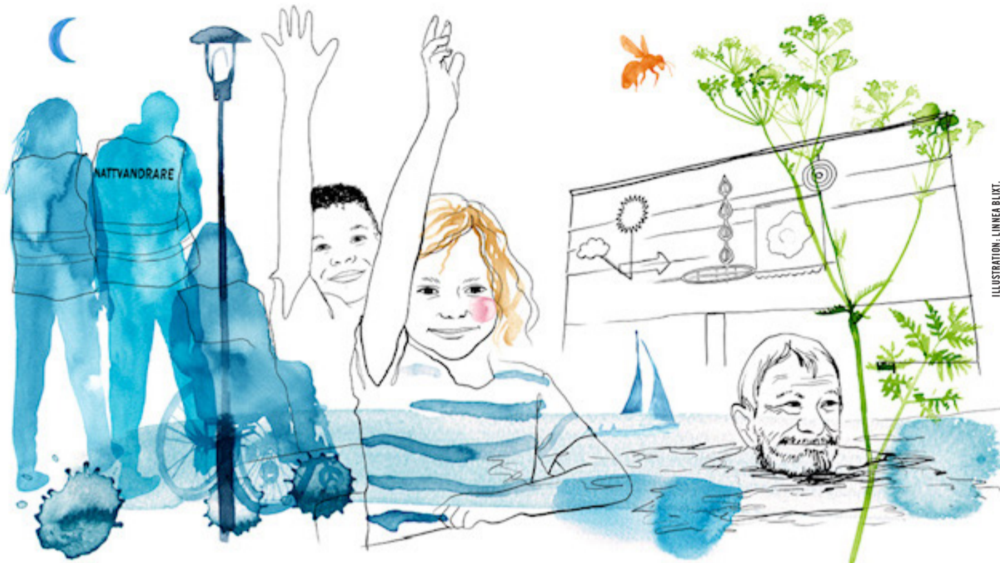
ILLUSTRATION: LINNEA BLITT