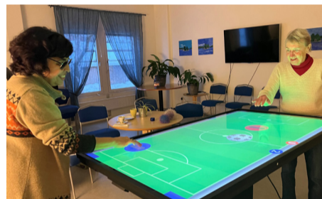
Skärmen roteras enkelt för en fotbollsmatch.

Yetitablets är förprogrammerade med 130–140 appar, som är utvalda för bland annat minne och hjärngympa, träning, kreativitet, musik, spel, resor, upplevelser och tidningar.