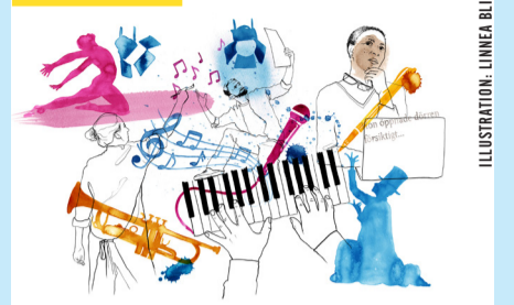
ILLUSTRATION: LINNEA BLIXT.